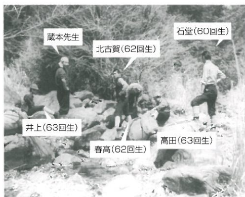
昭和37年3月 祖母、傾山合宿

間、全く人と出会わない飯豊連山(いいでれんざん)を走破し、下山してからは、市中パレードで歓待を受け、まるで浦島太郎のような錯覚を感じたものです。肝心の成績は、全国親善登山みたいな形になりましたが、そこではかなり厳しい指摘、指導があり、一瞬で厳しい現実を引き戻されました。そして悲しい事に、その一週間後に新潟大地震が起き、新聞等の報道写真を見ても、自分が渡った新潟大橋が崩れ落ち、方々での悲惨な状況が写し出され、お見舞の手紙を出したものの、最後にほろ苦い思い出となりました。