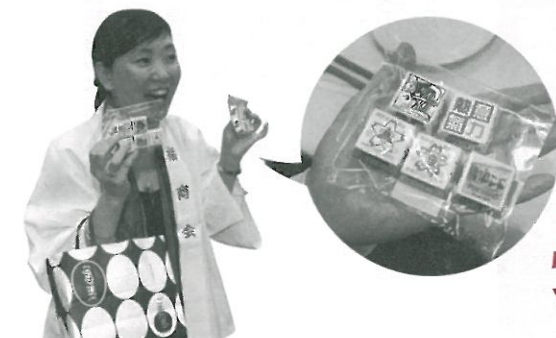
元気よくオリジナルチョコを販売

懇親会の会場では、楽しい企画やイベントを開催！福商の「熱・意気・力」がプリントされたオリジナルのチョコレートを限定販売。