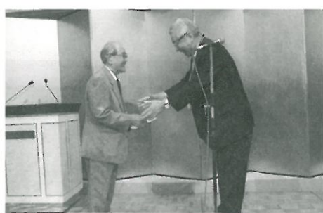
米寿のお祝い (36 回生)