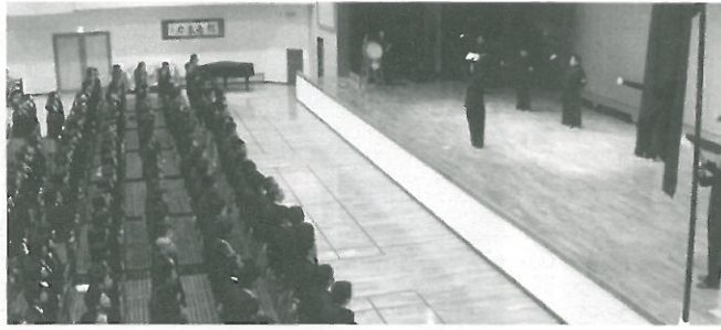
応援団 OB の演舞

4月23日、福翔創立109年記念行事の中に、福翔高校応援団OBによるパフォーマンスがありました。ビシッとした学ランを着て、堂々とした雰囲気です。ステージに立ち、ステージの下では8メートルにもなる応援団旗を汗だくになりながら一人で支えている。そんな先輩方の姿は、今まで応援団というものを見たことがなかった私の目に、とても格好よく映りました。「笑える所があったら遠慮なく笑っていいけんね」パフォーマンスが始まる前にそんなことを話されていましたが、先輩方の力の入った姿を見ると「笑えるような場面なんてあるのかな?」と、思えました。実際は司会の方が間に入り、ジョークも取り入れながら進めていただき、楽しく過ごすことができました。しかし、後になって考えてみると、司会者の合の手が入らなければ、私たちは応援団の空気に呑まれたままだっ