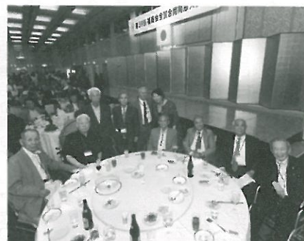
大先輩方も楽しく談笑