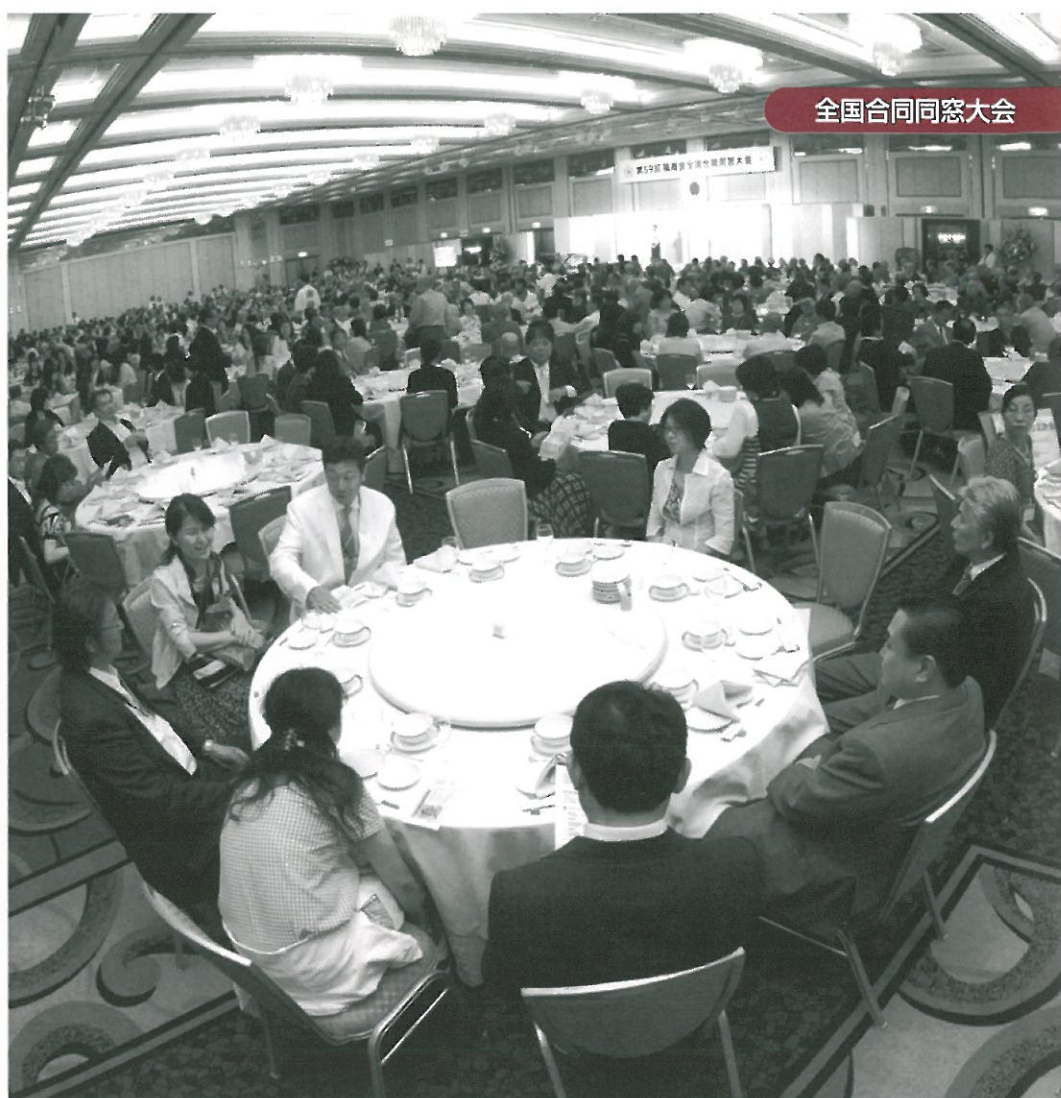
全国合同同窓大会