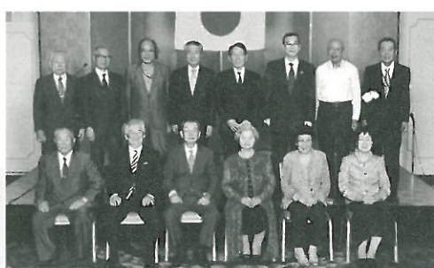
喜寿の皆様 (49 回生)