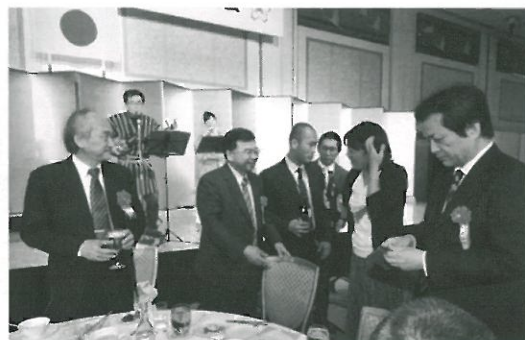
先生方も久し振りの再会