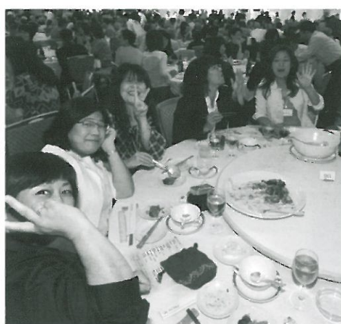
賑わう懇親会会場