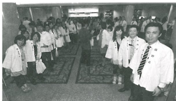
当番幹事の皆さんが笑顔でお見送り