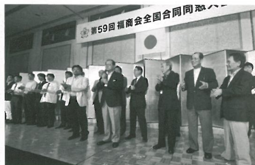
サッカー部OBの皆さん