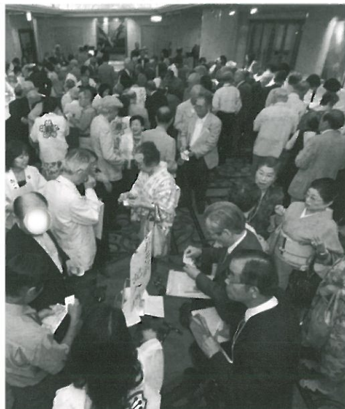
再会を喜び混雑する受付