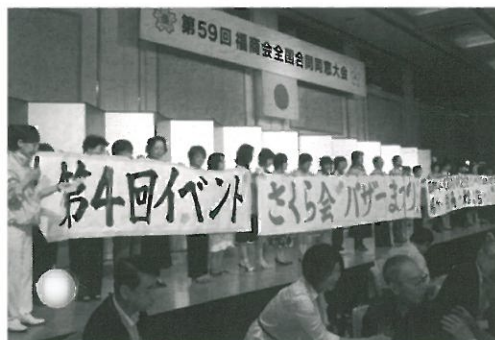
さくら会からバザーの案内