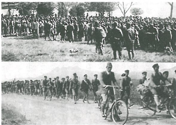
大濠公園に集合してスタートした二十里行軍

1943（昭和18）年1月、「中等学校令」が公布され本校の修業年限が5年から4年制へと短縮された。