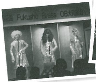
会場を盛り上げる仮装ダンス