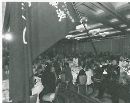
力強く旗での応援