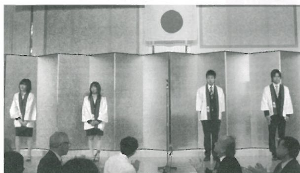
新入会員の紹介 (107 回生)