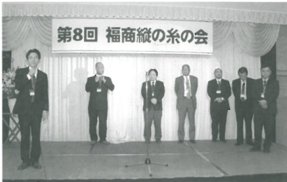
福翔高校先生がたの紹介