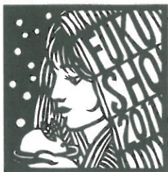
引頭先生による切り絵

ホワイトクリスマスとなった12月24日白いトナカイが先生を迎えに来ました。突然！先生の訃報を耳にした時「何で？どうして？」と疑いました。私だけでなく教え子すべてがそう思ったに違いありません。あ又何回も何回も「同窓会」「勘ちゃん会」で先生に会えると思っていたのに。「同窓会」も「勘ちゃん会」も終わった。「お前たちは大体何ば考えとつとか！バカタシがあ〜」と笑いながら叱咤激励して下さった先生の偉大さが、やっと分かりました。