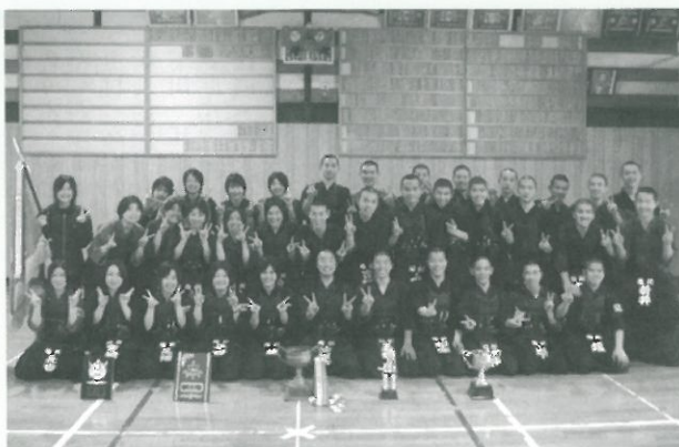
福翔高校男女剣道部