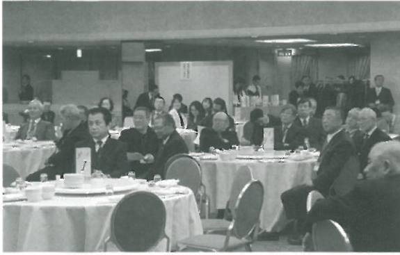
講演に聞き入る皆様