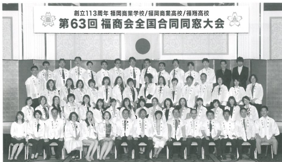
第63回 福商会全国合同同窓会 当番幹事一同