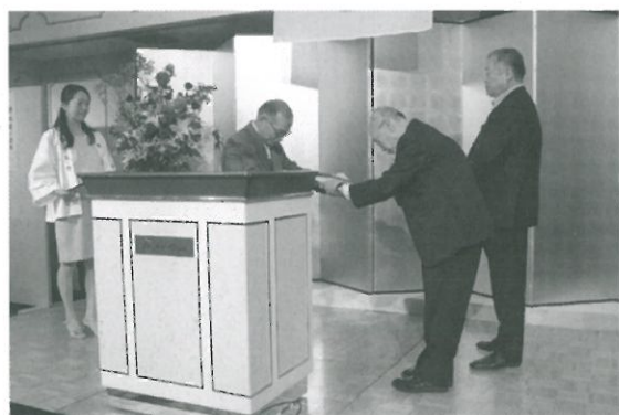
61回生、69回生への感謝状