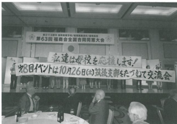
さくら会の皆さん