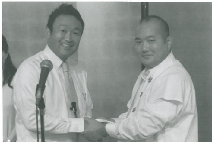
当番幹事引き継ぎ(88回生から89回生=右)