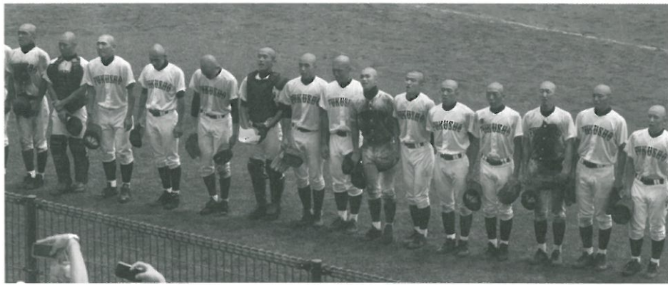
試合終了後の挨拶