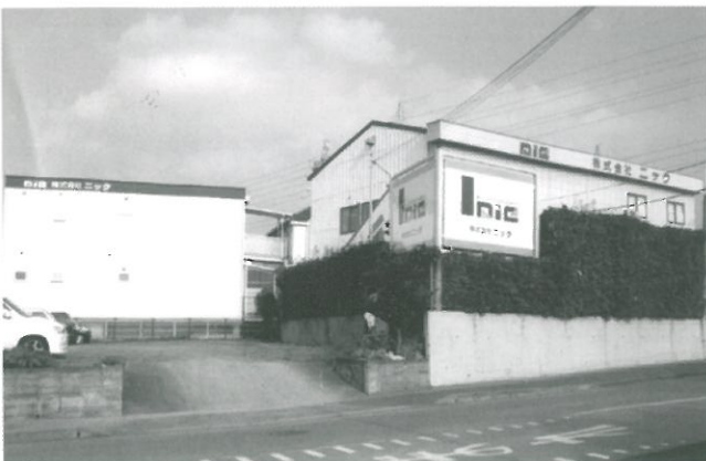
福翔高卒業生 15人が勤務する(株)ニック

な会社に入社でき、就職するために3年間私を育ててくださった福翔と、採用して下さった当社に感謝して、これから先輩方のようになるように前向きに頑張っていこうと思っています。 ニックの一つの仕事の中に、障がい者に関する福祉システムを地方公共団体や福祉事業所へ提供しています。そのシステムでの問い合わせに対応するのが今の私の仕事です。電話対応のため、話し方や説明の仕方が難しく日々苦戦しております。今は、先輩方に教えていただくことがほとんどで、システムや法令に関しても知識不足です。そのために、もっと勉強をし、ただ質問に回答するだけでなく、お客様にとってよりプラスになる情報も提供していけたらと思っています。これからも前向きに一生懸命働きたいと思っています。