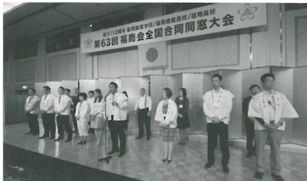
西宏史大会実行委員長より開会のことば