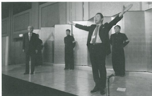
応援団からのエール