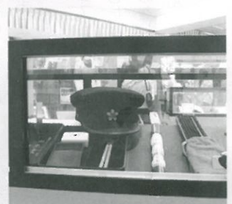
展示されている帽子