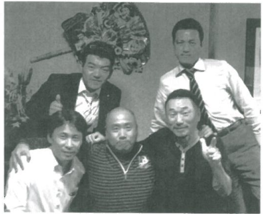
OG、OB ゴルフ大会参加メンバー 5人