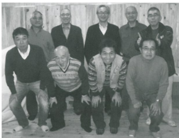
11月23日に仕事関連の福商会68回生が集 まった時の写真である。