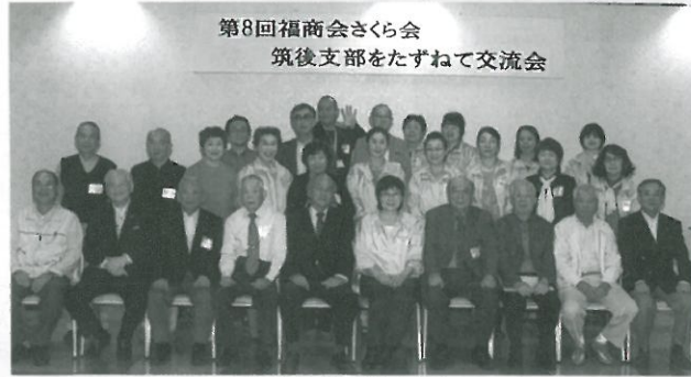
筑後支部の皆さんと