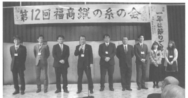
学校・父母教師会の皆さん