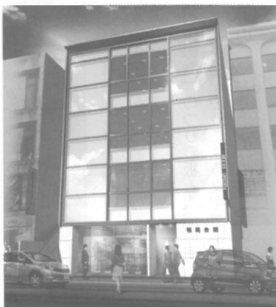
リニューアル完成予想図

続いてテナント退去申し入れが昨年7月のため、26年度の予算計上が出来なかった点。耐震工事の必要性、新テナント募集のための会館リニューアル、設計及び工事管理費用、テナント募集費用が発生する点を説明し工事費用の使用承認を求めた。